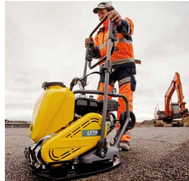
Der Führungsbügel kann übergeklappt werden, das bringt Wendigkeit an Kanten und Hindernissen.