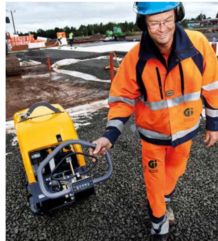
Der gut erreichbare Hebel für schnellen hydraulischen Fahrtrichtungswechsel.

Die optionale Verdichtungsanzeige der LG400 zeigt ihnen mit einem eindeutigen Lichtsignal an, wann der gewünschte Verdichtungsgrad erreicht ist. Damit verhindern Sie unnötige Überfahrten und Überverdichtung genauso wie unzureichende Verdichtung und damit aufwändige Nacharbeiten. Sie wissen also wann die Arbeit getan ist und sparen Zeit und Geld.