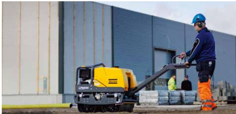
Die Vibration kann je nach Einsatz an- oder ausgeschaltet werden.

Die Seitenschutzbleche verfügen über praktische Verzurrpunkte für sicheren Transport. Der großdimensionierte, korrosionsfreie Wassertank reduziert die Anzahl der Unterbrechungen zum Nachfüllen und dient zusätzlich als Schutz für den Kühlerlüfter. Wenn der Tank abgenommen wird, besteht freier Zugriff auf die darunterliegenden Komponenten.