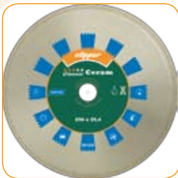
CLASSIC CERAM Ø 250 x 25,4mm