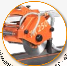
Schwenkbarer Schneidkopf (0° - 45°)