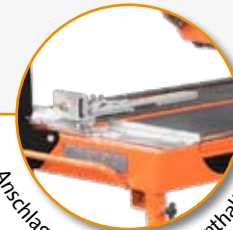
Anschlag im Lieferumfang enthalten.