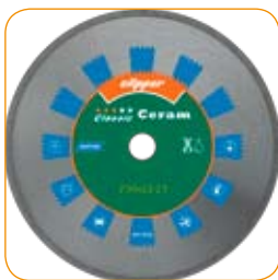
CLASSIC CERAM Ø 250 x 25,4mm