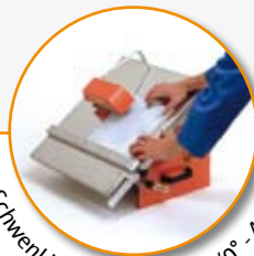
Schwenkbarer Schneidstisch (0° - 45°)